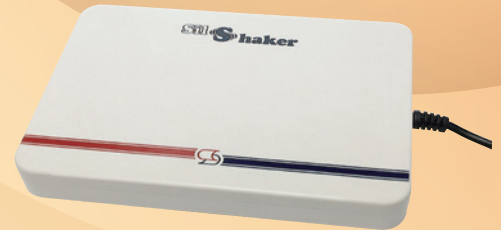
就寝時専用受信器